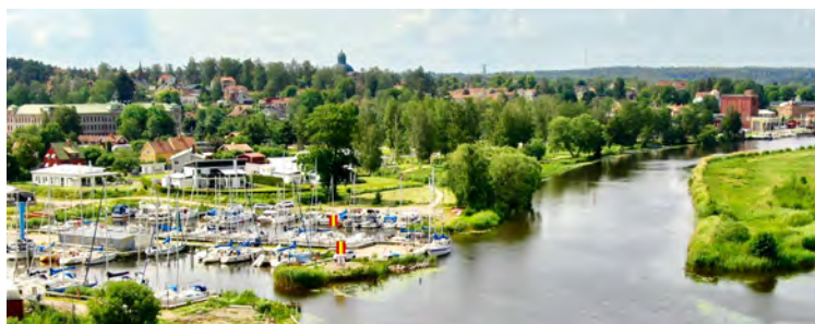
Kungsör, vid Mälarens strand - välkommen till kungariket!