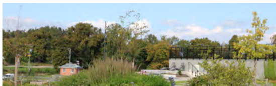
Parkerna i Kungsör välkomnar med vacker växtlighet.

På kungsor.se och på facebook.com/kungsorskommun får du information om kommunen och sådant du kan göra här. I evenemangskalendern tipsar vi om sånt som är på gång