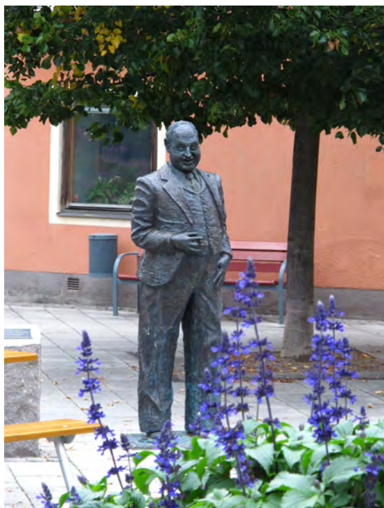
Thor Modéen föddes i Kungävr 22 januari 1898. Skådespelaren och revyartisten spelade in 88 filmer.

Konst- och hantverkssafarin arrangeras varje år en helg i maj. Då kan du på ett 20-tal olika platser, både i tätorten och runt om i de vackra omgivningarna, besöka cirka 50 konstnärer och hantverkare. Under övriga året pågår olika konstutställningar i bibliotekets utställningshall och det finns flera aktiva konstnärer och hantverkare i och runt Kungävr.