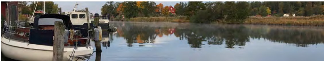
Gästhamnen en oktober morgon.

Kungsörs brukshundklubb driver och sköter hundarenan. Hallen på cirka 1 100 m 2 är uppvärmd och lämpar sig bäst för hundträning. Hallen går också att hyra.